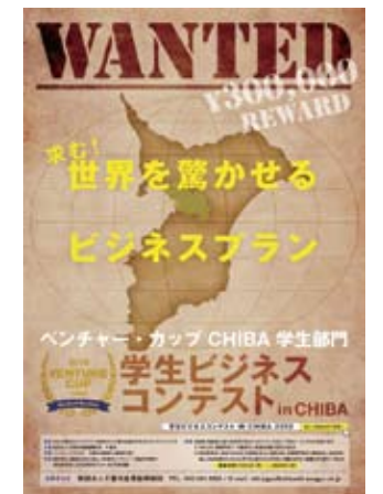
ベンチャー・カップCHIBAの案内