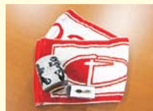
タオル、湯呑み、ネクタイピン

2口以上ご寄附くださった方には、お礼の品を差し上げております。今年度からお礼の品を一新しましたので、ご紹介いたします。ただし、お一人様につき一度限りとなっておりますのでご了承ください。