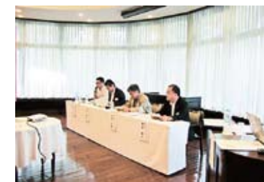
報告をする役員の皆様